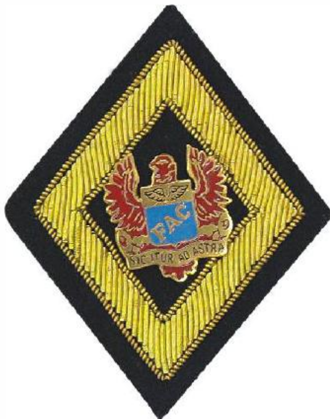
Figura 1. Rombo de gala con escudo